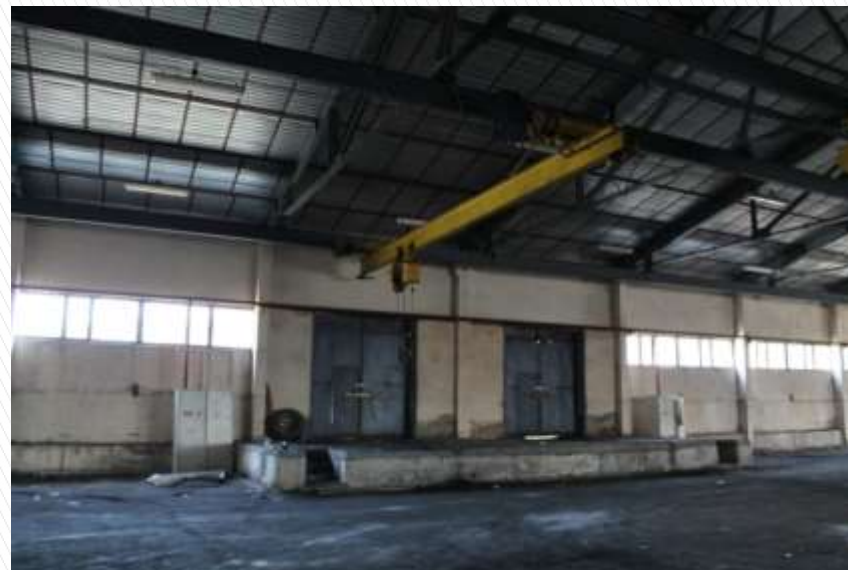
Рампа внутри склада