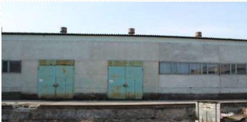
Рампа с ж/д веткой