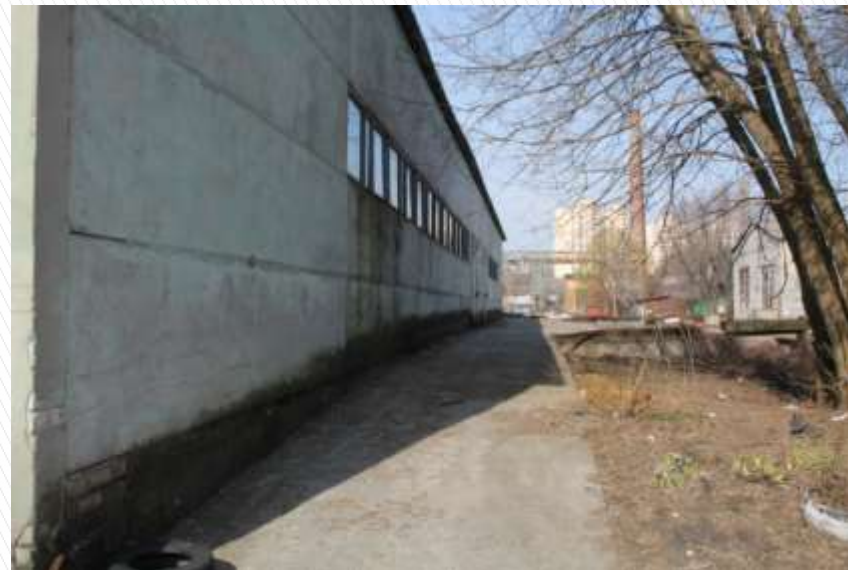
Пандус на рампу