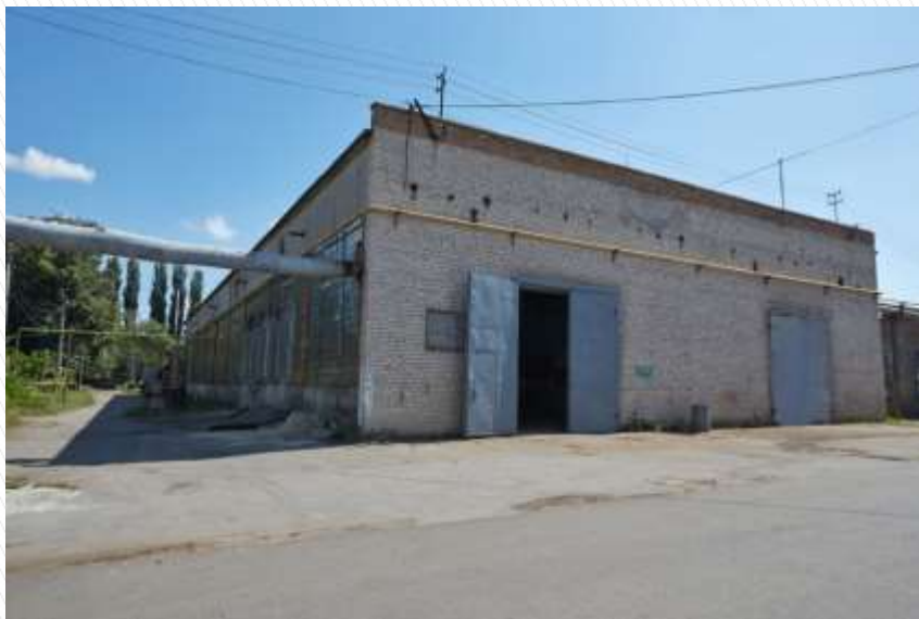
Въездные ворота с территории завода