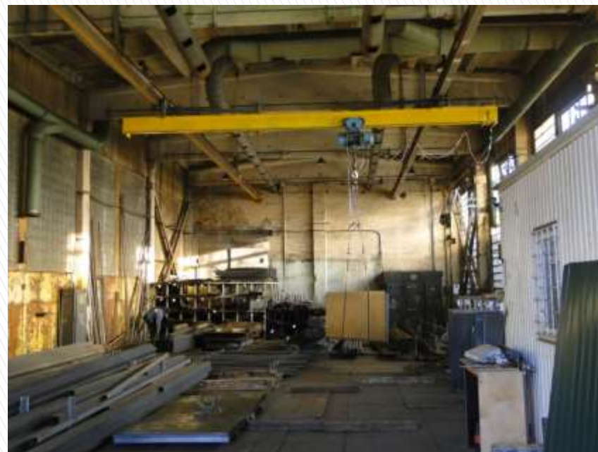
Производственный цех с кран-балкой